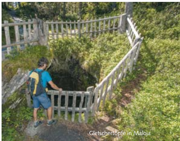
Gletschertöpfe in Maloja