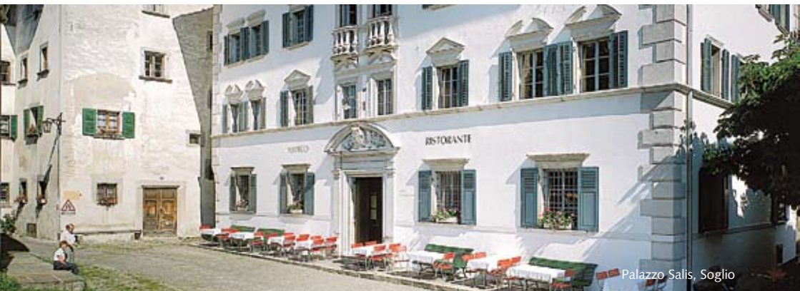
Palazzo Salis, Soglio

Treffpunkt: 16.00 Uhr, PostAuto-Haltestelle Vicosoprano Piazza (Dorfmitte) Kosten: gratis Dauer: ca. 1½ Stunden Anmeldung: bis Donnerstag, 11.00 Uhr, Tel. +41 81 822 15 55, info@bregaglia.ch