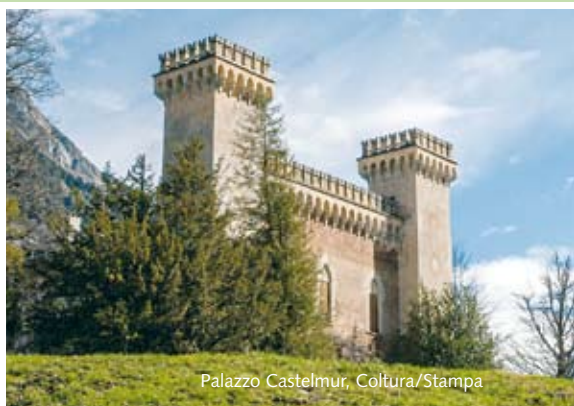
Palazzo Castelmur, Cortura/Stampa