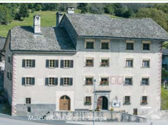
Museum Ciasa Granda, Stampa