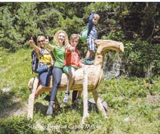
Schmugglerpfad Capel, Maloja

Begehbar: in der schneefreien Periode Führungen: auf Anfrage, Tel. +41 81 822 15 55 oder info@bregaglia.ch