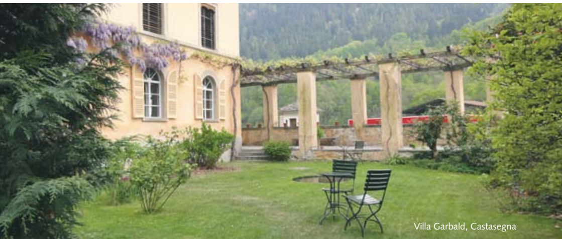
Villa Garbald, Castasegna

Führungen: jeden Samstag um 15.00 Uhr Kosten: CHF 8.- pro Person Anmeldung: erwünscht. Tel. +41 81 838 15 15 Aktuelle Kunsteinrichtung: Claudio Moser