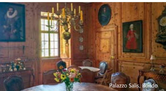
Palazzo Salis, Bondo