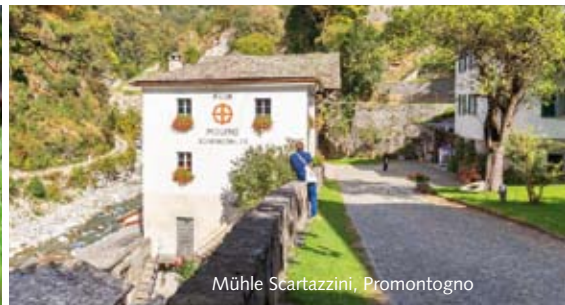
Mühle Scartazzini, Promontogno