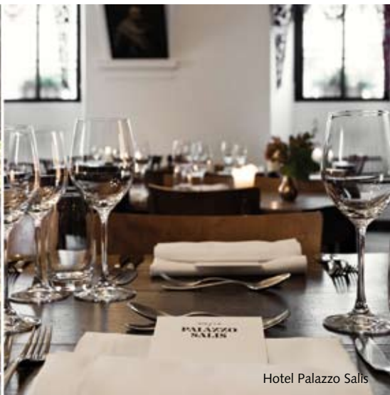
Hotel Palazzo Salis