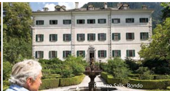
Palazzo Salis, Bondo