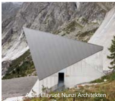
Alder Clavuot Nunzi Architekten